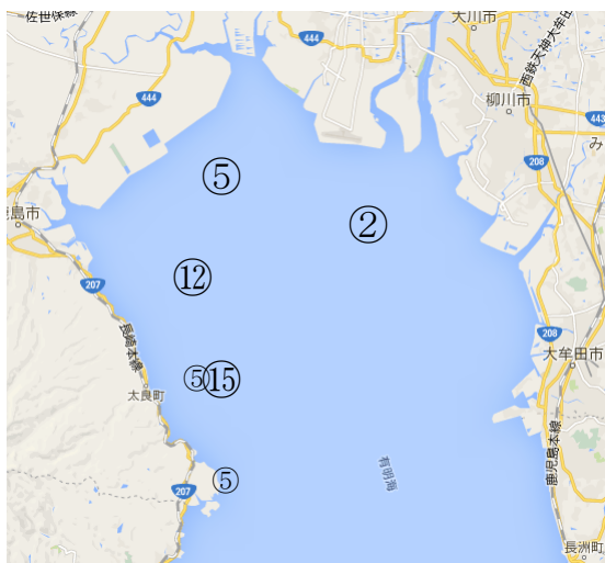
図 1. 採泥地点（地図は google map からの抜粋）

実試料は、冷蔵庫で遮光保存していた、2012 年 8 月 23 日と 12 月 28 日、2013 年 2 月 12 日と 8 月 22 日、2014 年 8 月 27 日に有明海佐賀県海域でサンプリングした底泥である。図 1 に採泥地点を示した。今回の測定では 8 月の 3 年間分は 4 つの測定点全てを測定し、2012 年 12 月と 2013 年 2 月の底泥は採泥地点⑮のみ測定した。測定には湿ったままの底泥をグローブボックス中で窒素ガスを流しながらポリエチレン袋に詰めたものを使用した。クーラーボックスに入れて冷やしたまま九州シンクロトロン光研究センターに持って行き測定した。