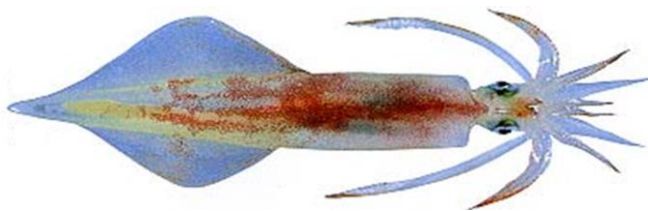
図1 ケンサキイカ (上) と軟甲 (測定位置)