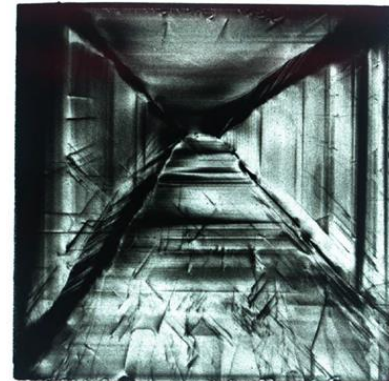
図2 HPHT基板（3mm角）の X線トポグラフィ像 \langle 404 \rangle