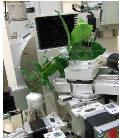
写真1 蛍光 X 線分析の様子

シンクロトロン光は高輝度かつ幅広いスペクトルを持ち、測定手法が確立できれば、対象物の無機元素を非破壊で迅速かつ詳細に分析可能であることから、樹体内の元素の動態や各器官における元素の分布の解析が期待できる。本研究ではシンクロトロン光を利用したチャおよびツバキの非破壊的蛍光 X 線分析を行い、無機元素の動態解析に必要な基礎的な知見を得る。本報告では、最も適した施肥の時期や量の推定を行い、高品質なお茶を安定的に生産する技術を確立することを目的として、茶樹体における非破壊的な施肥処理後の無機元素の樹体内動態について調査した。