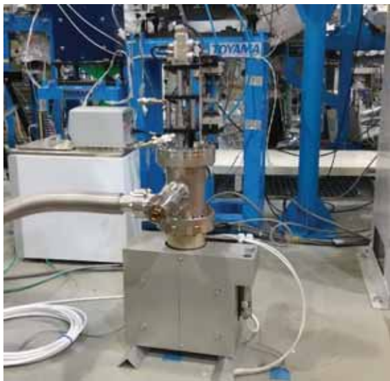
図2. 更新用のRABSおよびイオンポンプ。

BL13は、SAGA-LSの運用開始当初から利用を継続しており、ビームライン機器の多くは設置から16年を経過した。特に、蓄積リングとの接続部にあるリングアブソーバ(RABS)を初めとする基幹部機器について、老朽化対応のための更新が必要であった。これらの問題点を解消するため、2020年度においては、RABS、メタルゲートバルブ、ビームラインシャッター、およびイオンポンプなどの基幹部機器について更新用機器を製作・購入した。これにより、SAGA-LSのシャットダウンスケジュールに合わせて機器更新を行う準備を整えた。