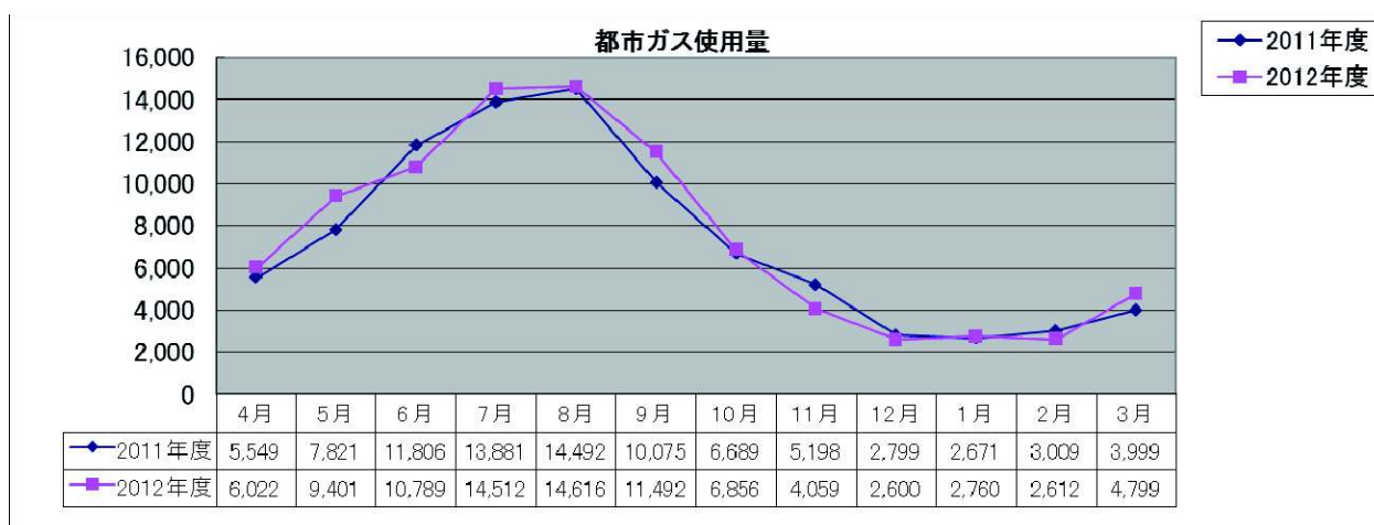
図3 月別都市ガス使用量(単位：m 3 )