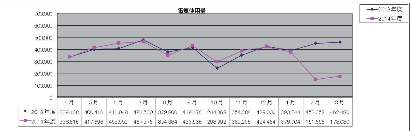
図1 月別電気使用量(単位 : kWh)