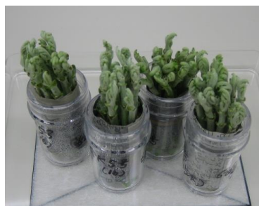
図1. 照射用のキク穂