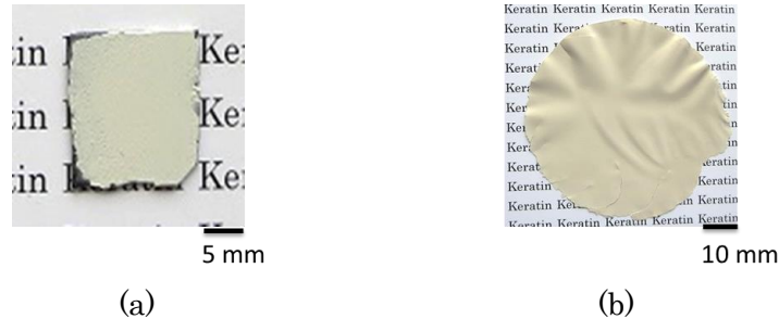
Fig. 1 Image of keratin film prepared by Pre-cast method (a) Silicon wafer type (b) Free standing type

実験に用いたフィルムはそれぞれ製法の異なるPre-cast型、貧溶媒が高酢酸タイプのPre-cast型、Soft post-cast型の3種とした。BL15は平板に試料を固定する必要があるため、シリコンウェハー支持体上に製膜したフィルムを用いた。BL11は透過法で測定を行うため、支持体を使用しない自立型フィルムを用いた。測定試料は化学処理を施さない未処理型に加え、それぞれに還元処理を施した3種を合わせた計6種とした。